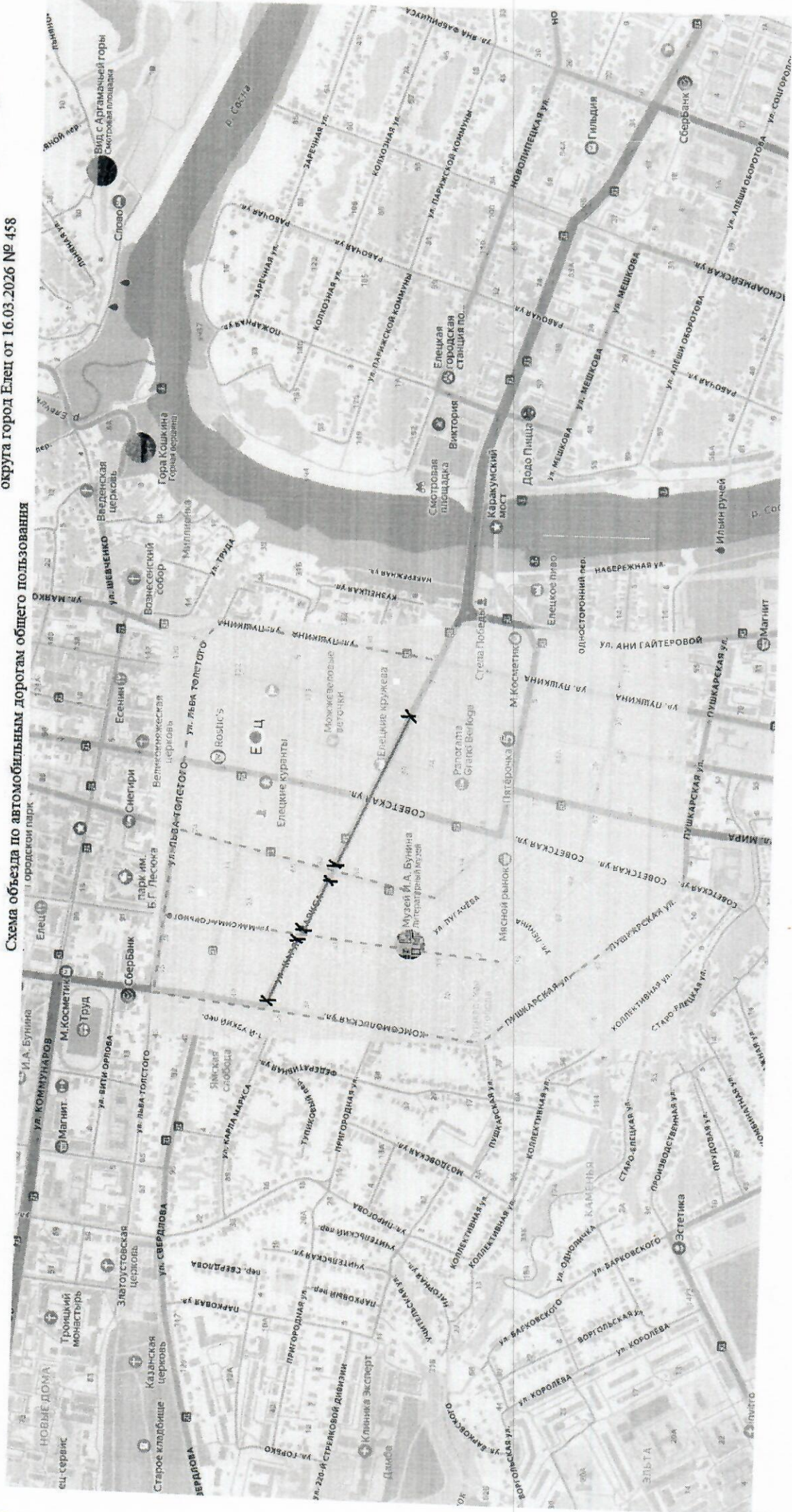
Схема объезда по автомобильным дорогам обогного пользования

«Приложение № 1 к постановлению администрации городского округа город Елец от 16.03.2026 № 458