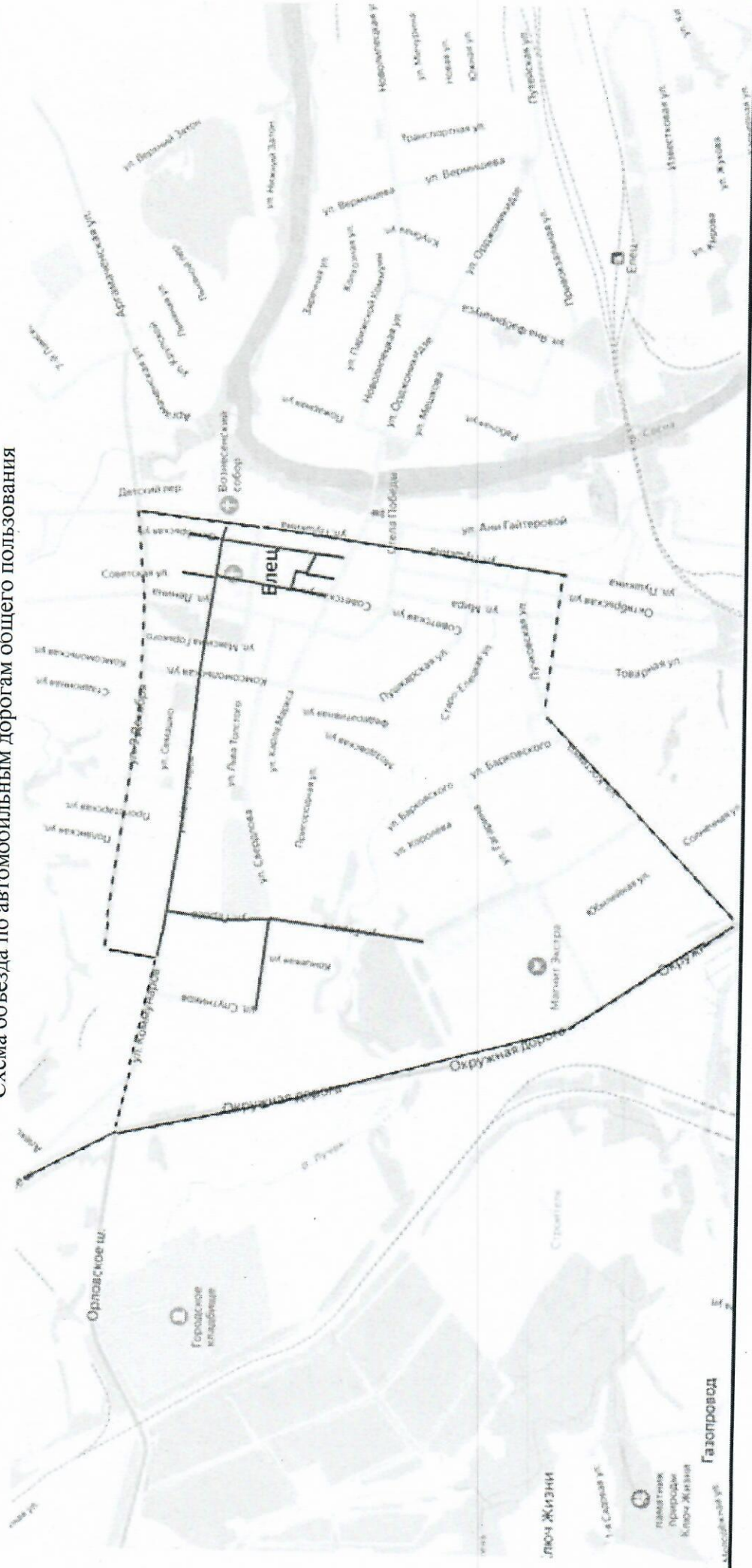
Схема объезда по автомобильным дорогам общего пользования